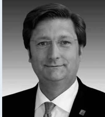
Dirk Elbers Oberbürgermeister der Landeshauptstadt Düsseldorf